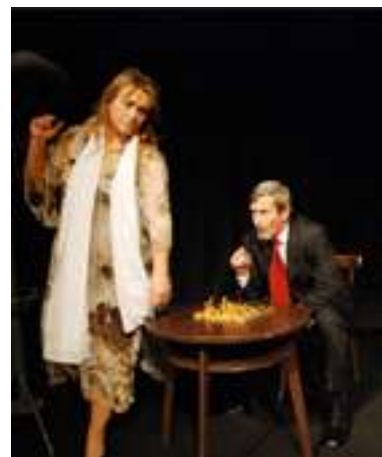
Václav Havel ODCHÁZENÍ