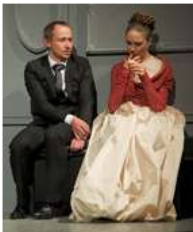
Michail Jurjevič Lermontov MAŠKARÁDA