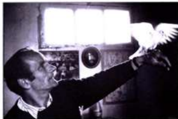
JINDŘICH ŠTREIT Fotografie - 15. 9. 2008